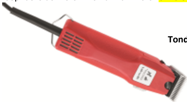
Tondeuse naar onder richten tijdens het oliën

LET WEL steeds de tondeuse met de kop naar onder richten bij het aanbrengen van olie anders loopt deze de motor in en dit kan motor onherstelbaar beschadigen.